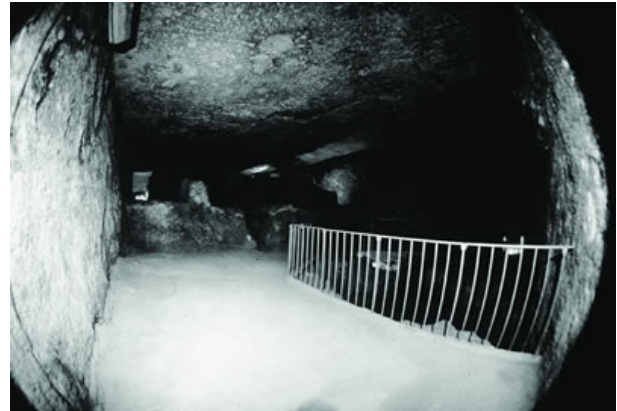
Wielka Komora Podziemna (zniekształcenia obrazu są spowodowane użyciem obiektywu szerokokątnego)

Niski tunel odchodzący z Komory prowadzi donikąd, a z pewnością nie do żywota. Tunel nie wpuszcza do wewnątrz powietrza, jak czynią to kanały powietrzne w Komorze Króla. Widać więc, że symbolika pozostaje powiązana z tematem śmierci.