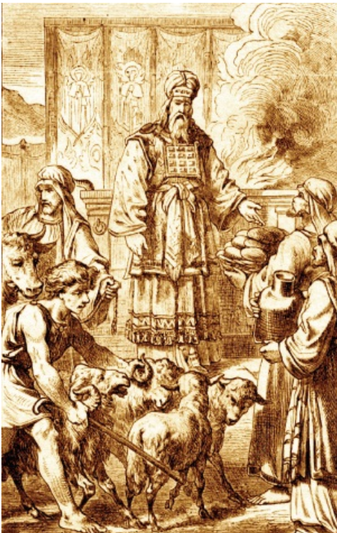
Rycina pt. „Kapłaństwo Izraelitów w Przybytku Przymierza” ze schrobenhausenowskiego warsztatu Carla Poellath. Bezpośredni autor

W niniejszym artykule spojrzymy właśnie na ludzi z pokolenia Lewiego, których Bóg wybrał, aby tam służyli i spróbujemy znaleźć odpowiedź na pytanie, w jaki sposób ich służba i związane z nią przepisy były „cieniem rzeczy przyszłych”.