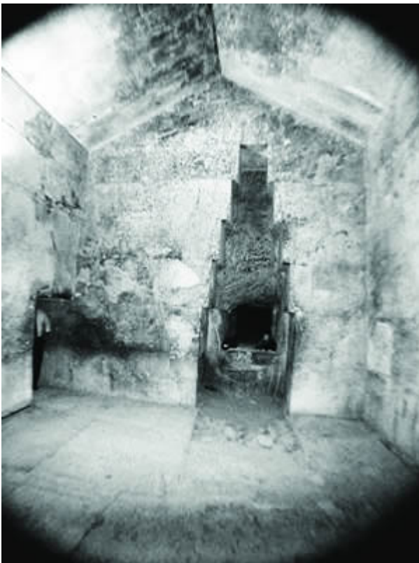
Nisza w Komorze Królowej

Nisza ma głębokość prawie 1 m i około ok. 4,8 m wysokości. W przeszłości, rabusie wyrąbali tunel na kilka metrów poza tylnią ścianę niszy, daremnie poszukując tam skarbów. Nisza składa się z systematycznie zwężających się ku górze segmentów. Szerokość niszy u podstawy wynosi ok. 1,57 m, natomiast u szczytu ok. 0,5 m.