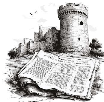
PRZEDRUKI WATCH TOWER